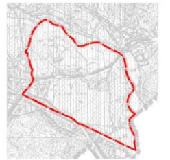
wyciąg ze studium uwarunkowań i kierunków zagospodarowania przestrzennego miasta Jelenia Góra